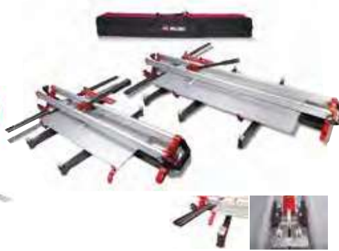
Modelo TZ1300. Longitud de corte 130 cm.

Rápido sistema operativo mediante imán, operable con una sola mano. Mayor facilidad y velocidad de corte. Alta visibilidad durante el rayado. Potencia separador - 800 kg. Con maleta.