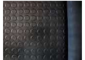
Lisa. Espesor 2mm. Peso 30 kg.