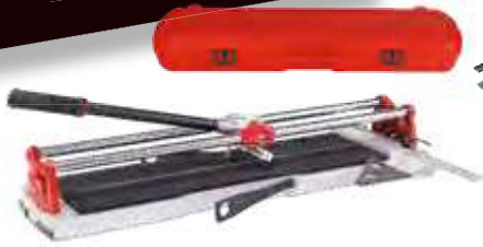
Modelo Spedd Magnet-62. Longitud de corte 62 cm.